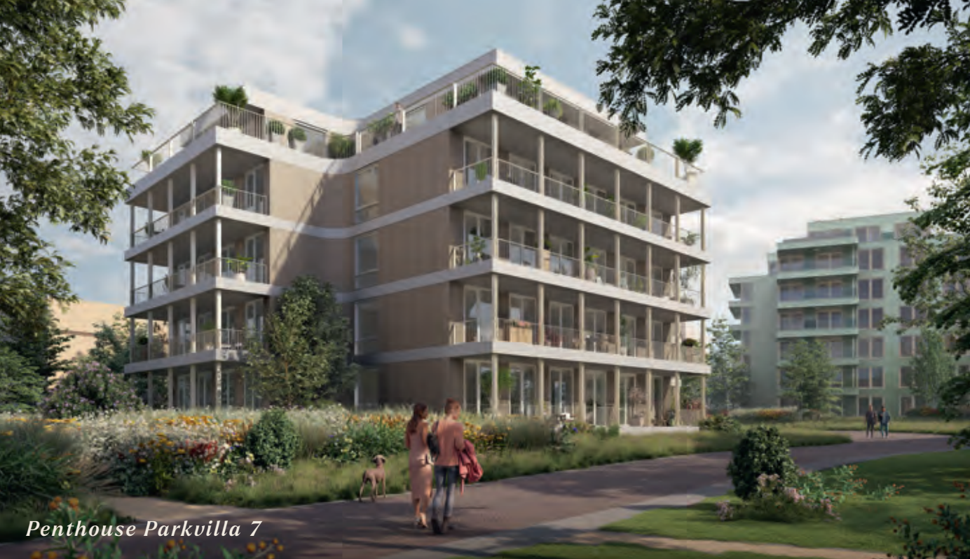
Penthouse Parkvilla 7