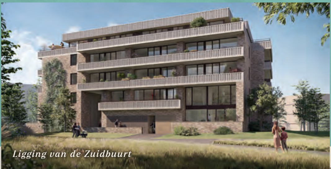
Ligging van de Zuidbuurt

In totaal worden hierin 73 appartementen, dubbele benedenhuizen en penthouses gerealiseerd.